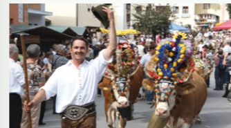
Larch Peter „Neubauhof“ von der Pfundsalm | Hochfügen im Zillertal

Am 23.09. oder 30.09. ab ca. Mittag Heimfahrt der Bauern mit ihrem geschmückten Almvieh durch das Ortszentrum von Reith im Alpbachtal. Änderungen vorbehalten!